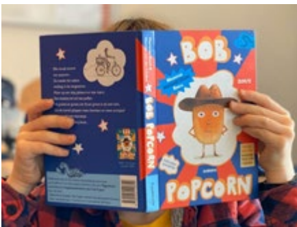
Aflevering #1 Levi (7) met Bob Popcorn