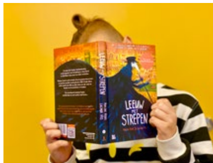
Aflevering #2.2. Arie (10) met Leeuw met strepen