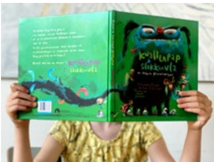
Aflevering #2 Eefke (7) met Kwallenpap en slakkenvla